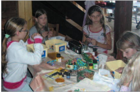
Die Mädchen bastelten wunderschönen Perlen-schmuck und Stofftaschen.

Thematisch haben wir uns mit David beschäftigt, den Gott vom Hirtenjungen zum König erwählt hat.