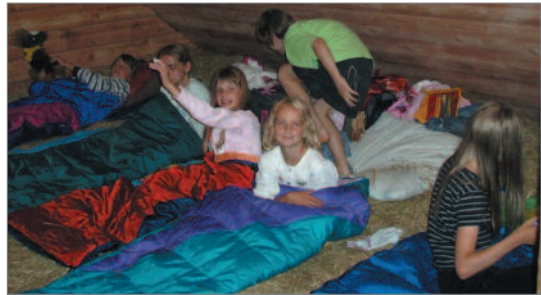
Übernachtet wurde auf dem Dachboden der großen Scheune im Heu.